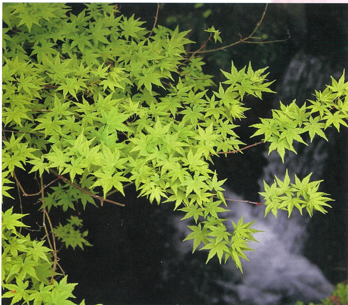
『沢のモミジ』 ~八王子市フォトギャラリーより~

©Hachioji City (licensed underCC BY 4.0)