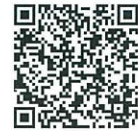
▲「90秒でわかる事業承継税制特例措置のポイント」