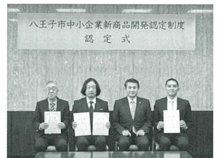
八王子市中小企業新商品開発認定制度 認定式

<お問合せ先> 八王子市産業振興部 産業振興推進課 TEL: 042-620-7379