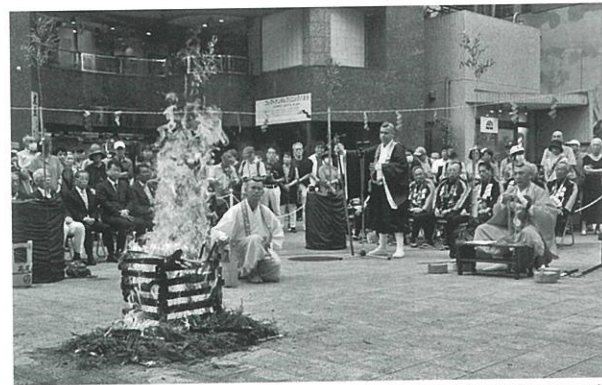
昨年の様子(柴燈護摩祈禱)