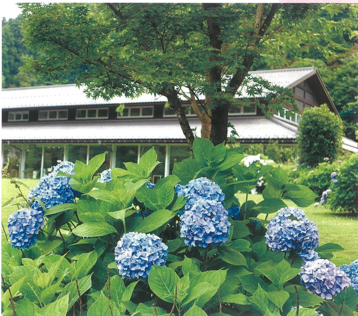
『高尾599ミュージアムのアジサイ』