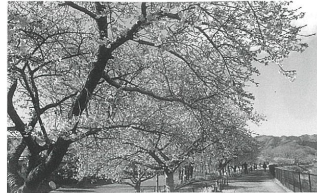
【八王子観光カレンダー2025】より(小田野中央公園(4月))