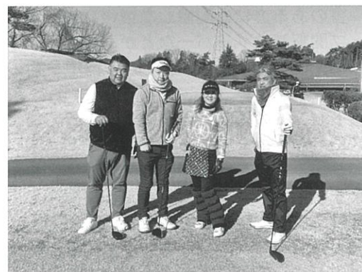
ゴルフで交流親睦を

2月21日、GMG八王子ゴルフ場にて、八王子市内青年三団体(八王子商工会議所青年部、八王子青年会議所、八王子法人会青年部会)による交流ゴルフコンペが開催されました。早春の澄み切った空気の中、各団体のメンバーが一同に会し、プレーを通じて親睦を深めました。普段は異なる分野で活躍するメン