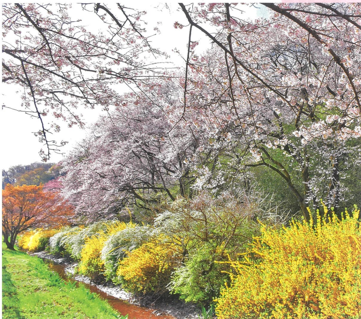
『滝ヶ原運動場の桜』