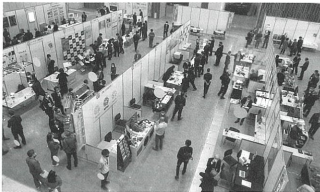
交流展の様子（東京たま未来メッセ）

当日は55社・団体が出展し、合わせて「今後の中小企業経営」「SDGs」「ものづくりAI革命」をテーマとした3講演会の同時開催などもあり、約500名余