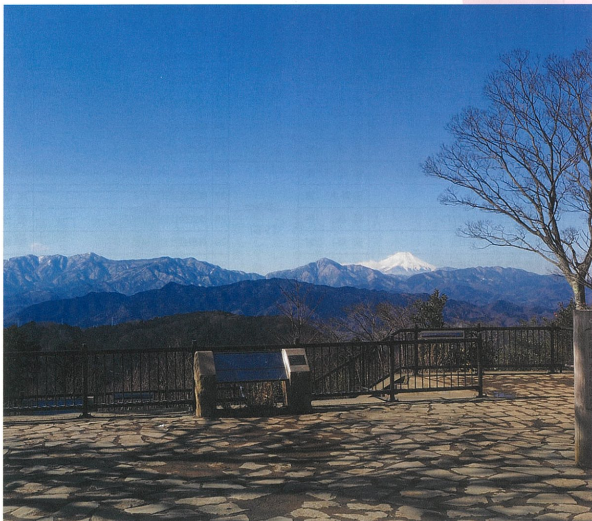
『高尾山からの眺望』 ～『八王子景観100選』より～