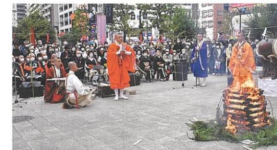
高尾山薬王院による「柴燈護摩祈禱」