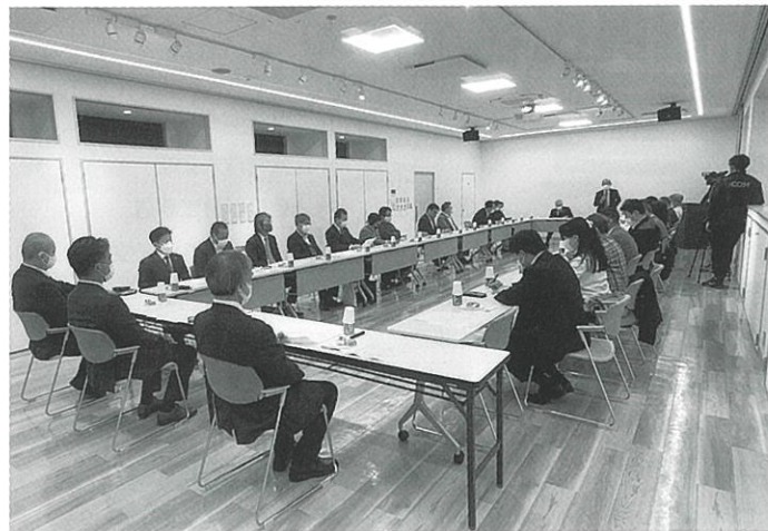
当日は29社の老舗企業が出席

八王子は、江戸時代は宿場町として、またその後織物業で発展した歴史的背景もあり、創業100年以上に渡る、いわゆる「老舗企業」が多い地域として当市商工業の特徴にもなっている。 そこで当会議所ではこの市内の老舗企業同士の連携体が出来ないかと検討を進めており、10月22日、それぞれの企業経営の歴史や事業継続のための知恵や工夫などを共有し、これから100年を迎える企業を含めた緩やかな交流の場としての「(仮称)八王子100年企業のれん会」の設立に向けた意見交換会を、まちなか休憩所(八王子宿)にて開催した。