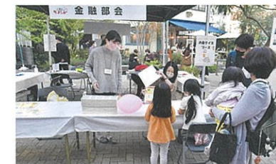
お金を知ろう！学ぼう！（金融部会）