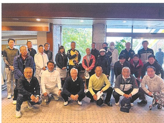
「ホールインワン」も飛び出したゴルフツアー