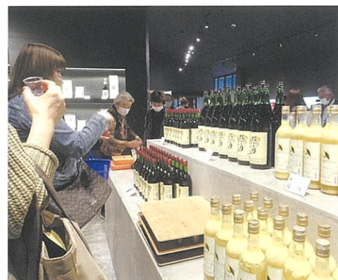
「笹一酒造」で試飲体験