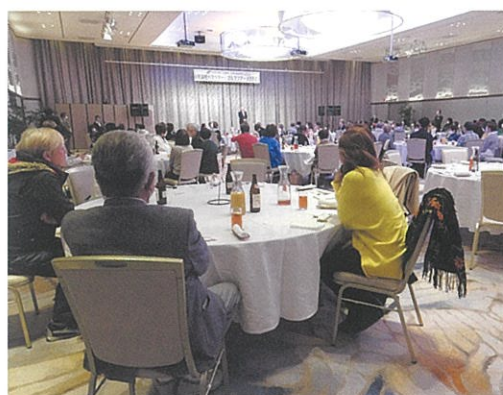
参加者が一堂に会した夕食会（ハイランドリゾートホテル）