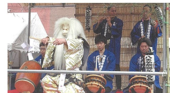
「お囃子」で賑わい作り（八王子祭囃子連合会）