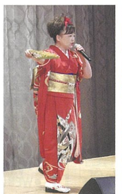
八王子育ちの演歌歌手「伊達めぐみショー」