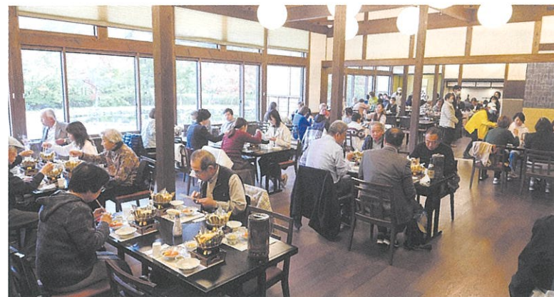
紅葉が美しい「忍野しのびの里」で昼食