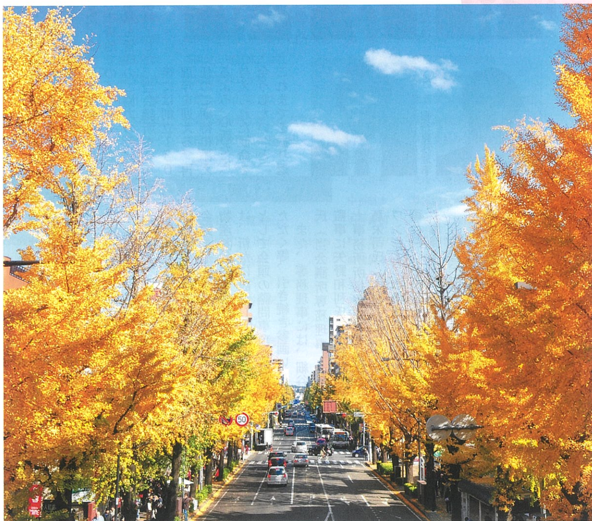
『甲州街道のイチョウ並木』 ～『八王子景観100選』より～