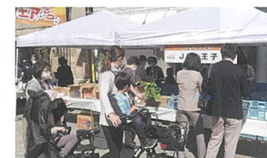
初出店のJA八王子による地元野菜販売