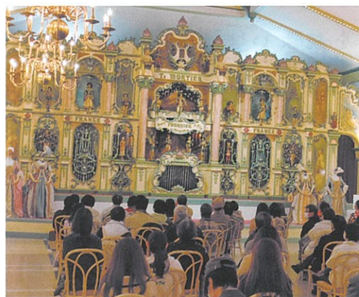
「河口湖音楽と森の美術館」にて