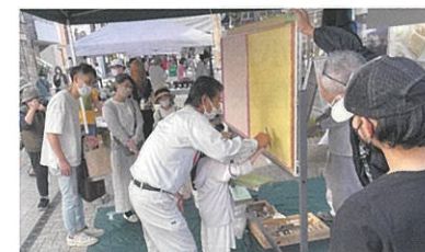
建築職人の技術を実演・体験（建設部会）