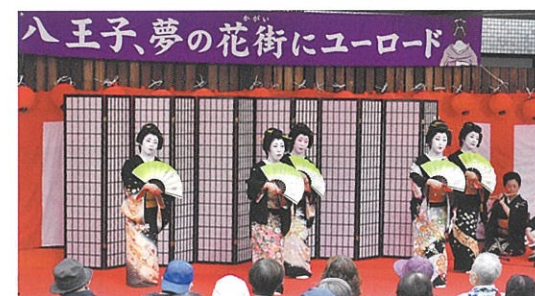
八王子芸妓衆「桑都の舞」（横山町公園ステージ）