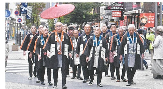
「木遣り」を先頭にユーロードをパレード