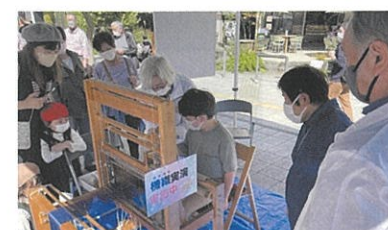
機織体験（繊維・ファッション部会）