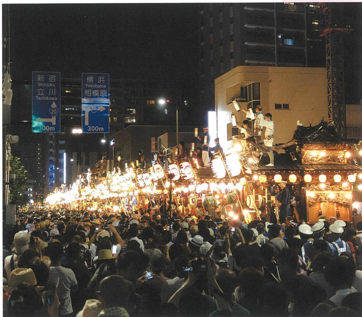
『歳時の舞台となる甲州街道』 ～『八王子景観100選』より～