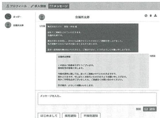
気になる求職者とはチャット方式でやりとりが可能

当ビジョンが、日本商工会議所発行「会議所ニュース」（2022年7月21日号）にて全国に紹介されました！