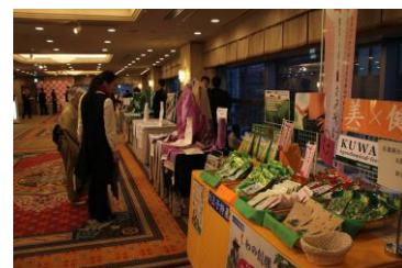
(ミニ展示コーナーの様子)

※ご希望の方は右記QRコードまたは、HPにてお申込みください。(1月25日締切)