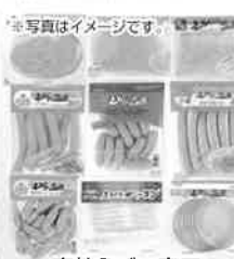
写真イメージです。 宮崎えびの高原加工肉