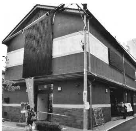
建物の構造は鉄筋コンクリート。床面積324.04㎡

今後も、行政とは密に連携をとりながら、地域経済活性化とまちづくりにしっかり取り組み、他市には絶対に負けない強い「八王子」を目指して貢献して参ります。(了)