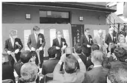
10月3日に行われた開設記念式典でのテークアップ