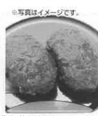
写真イメージです。 北海道中札内村産小豆使用 手造りおはき