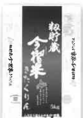
写真イメージです。 粉貯蔵今搾米 きたくりん