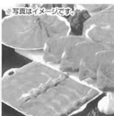
写真イメージです。 720牧場グループ牛

スーパーアルプスでは、お客様にぜひともご紹介したい優れた商品に「自信の品マーク」をつけました!! ものづくりにひたむきな生産者、製造メーカーに直接伺い、素材を吟味し、製造工程を確認しております。