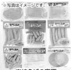
※写真はイメージです。 宮崎えびの高原加工肉