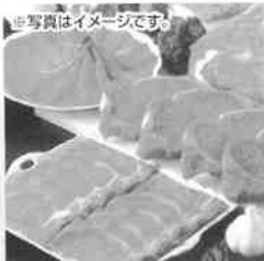
※写真はイメージです。 フニフニ720牧場グループ牛

T192-0011 東京都八王子市滝山町2-351 TEL042-692-2111(代)