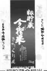
初貯蔵今搾米 きたくりん