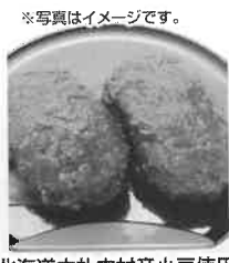
※写真はイメージです。 北海道中札内村産小豆使用 手造りおはぎ