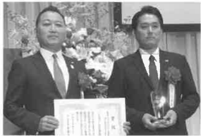
7月3日に行われた表彰式より(左側は平塚社長)

G-CROSSは、リフィルバッテリーを同時に最大4本挿入することができ、1500Wの連続出力が可能。特長は、特許技術の「無瞬断バッテリー代替技術」により、カセット式リチウムイオンバッテリーのリフィルバッテリーを出力中に交換しても、電気が途切れることなく出力を継続できることにあり、