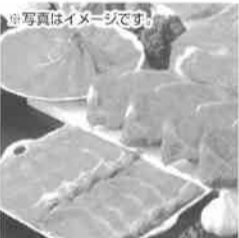
ナミア 720牧場グループ牛

T192-0011 東京都八王子市滝山町2-351 TEL042-692-2111(代)