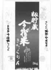
粉貯蔵今搗米 きたくりん