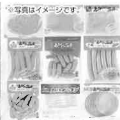
宮崎えびの高原 加工肉