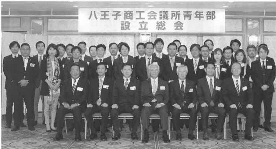
八王子商工会議所青年部 設立総会

発行所：八王子商工会議所 〒192-0062 東京都八王子市大横町11-1 ☎042-623-6311 FAX042-626-8138 http://www.hachioji.or.jp info@hachioji.or.jp