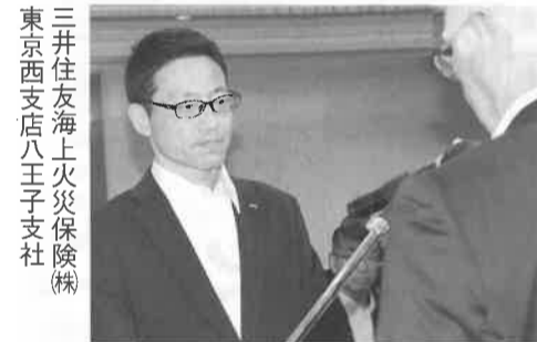
三井住友海上火災保険(株)東京西支店八王子支社