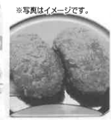
北海道中札内村産小豆使用 手造りおはぎ