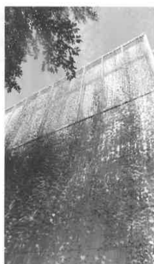
写真は平成29年度団体部門最優秀賞作品

つる性の植物を窓際にはわせることで、夏の陽ざしを遮り、部屋の温度を下げる効果のある「みどりのカーテン」。