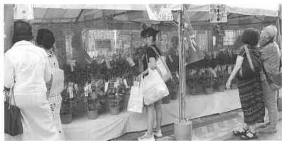
昨年の八王子・夏の風物市(あさがお市)より