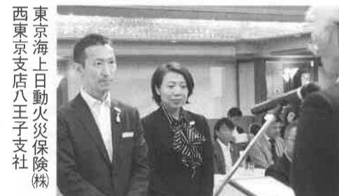
東京海上日動火災保険(株)西東京支店八王子支社

⑥関係機関との連携促進 くの市民に存在感を知らしめた。東京都市整備局との連携促進による産業界交流拠点と旭町・明神町地区再開発の一体的まちづくりへの積極的な意見活動ほか、MIC E都市推進のため八王子市観光コンベンション協会との連携を図るとともに、市制100周年に際して、都市緑化フェア、生活文化創造都市・八王子会議所をはじめ様々な記念事業など、行政との協働により成果をあげた。