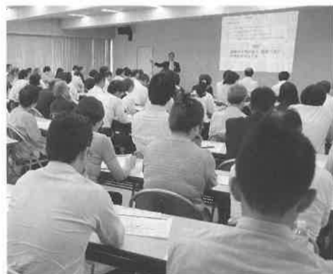
経営に役立つ講習会の実施

◆ 八王子都市文化伝承館検討委員会 郷土の歴史、地域を支えてきた織物産業、山車を中心とした都市文化を後世に伝承する施設について調査研究し、その報告書をまとめた。この実現のための具体的な方策について、調査・研究する。 ◆ 小企業等経営改善資金審査会 小規模事業者経営改