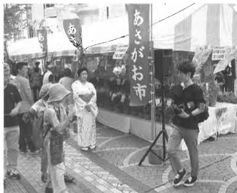
都市活性化イベントの実施

◆ 街づくりと都市基盤整備等に関する調査研究 ほか ◆ 交通観光飲食業振興に関する事業 ・公共交通事業者との連携による交通環境の改善 ・観光カレンダー、観光マップによる観光情報の発信 ・JAとの連携による地場野菜のブランド化推進 ほか ◆ サービス・情報産業振興に関する事業 ・誰もが暮らしやすい街づくりの研究 ・地域活性化のための新たな情報ネットワークの構築 ・健康増進都市八王子の研究・促進 ほか ◆ 金融に関する事業 ・中小企業の経営課題への金融支援 ・企業経営のサポートと各種情報の提供 ・共通価値の創造実践企業の普及啓発ほか