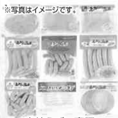
宮崎えびの高原加工肉