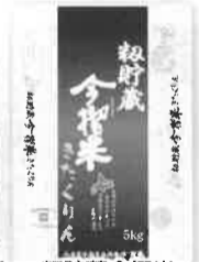
粉貯蔵今摺米 きたくりん