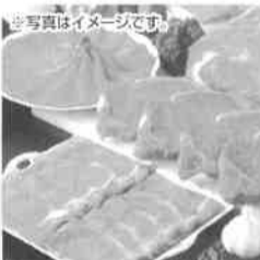
ナニワ 720牧場グループ牛

〒192-0011 東京都八王子市蒲山町2-351 TEL042-692-2111(代)