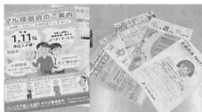
マル経融資と共済制度の普及