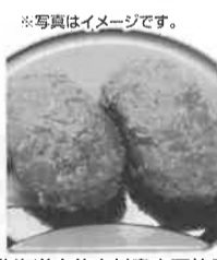
北海道中札内村産小豆使用 手造りおぼろ