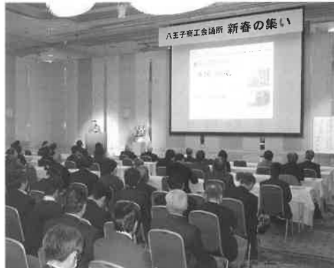
会員交流を目的とした事業の実施

◆ 商業振興に関する事業 ・郊外型大型店の出店計画に伴う商業調整 ・中心市街地活性化事業の推進 ・第8回八王子お店大賞の検討・実施ほか ◆ 工業振興に関する事業 ・受発注促進ならびに取引斡旋の推進 ・次世代経営者育成事業の推進 ・地域工業関連企業の交流事業の推進ほか ◆ 繊維業振興に関する事業 ・マーケットリサーチと新商品展示による産地活性化の推進 ・国内外のファッション振興に資するため情報収集および視察研修 ◆ Partie(パーティー) ・他関係製品の開発と普及促進事業 ほか ◆ 建設業振興に関する事業 ・市民・官公需関係者と建設業界との相互理解の推進 ・国・都・八王子市への提案・提言