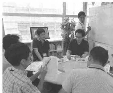
中小・小規模事業所のリーダー育成