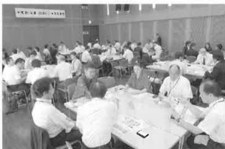
昨年の広域ビジネス会の様子

八王子・町田・相模原商工会議所会議員事業所の地域間相互の交流を図るとともに、ビジネスチャンスを創り、