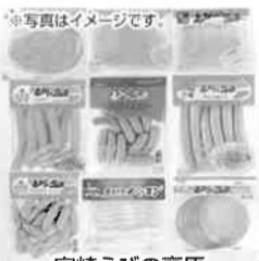
※写真はイメージです。 宮崎えびの高原加工肉