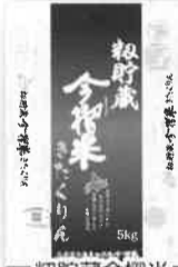
初貯蔵今播米 きたくりん