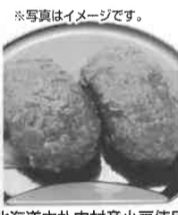
※写真はイメージです。 北海道中札内村産小豆使用 手造りおはぎ