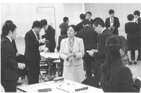
昨年度の新入社員ビジネスマナー研修の様子

会議所では、社会人としてのビジネススキルなどを身に付ける、新入社員ビジネスマナー研修を実施します。社会人としての意識の変化を促す研修です。ので、社員教育としてご利用ください。