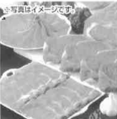
※写真はイメージです。 720牧場グループ牛

〒192-0011 東京都八王子市滝山町2-351 TEL042-692-2111(代)