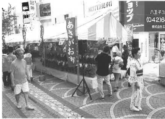
芸者衆もあさがおを販売

7月8日～9日にお たり、八王子・夏の風 物市実行委員会は、西 放射線ユーロード中町 エリアを会場に『八王 子市市制100周年記 念事業第16回八王子・ 夏の風物市(あさがお 市)』を開催した。 あさがお市には、八 王子の生産農家が丹精 こめて育てた、八王子 産あさがお600鉢、 涼しい音色を奏でる江 戸風鈴、金魚、水草、 花、飴細工実演、地元 商店会の販売ブース、 八王子の物産品の販売 ブースなどが多数出店 した。