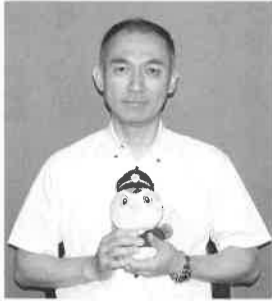
西東京バス(株)常務取締役 管理部長 明神町3-1-7 ☎646-9012

八王子夏の風物市のお手伝いも今年で3年目になり、江戸風鈴の売り場を担当しました。地域の皆様が親しく接してくださるのでうれしいです。