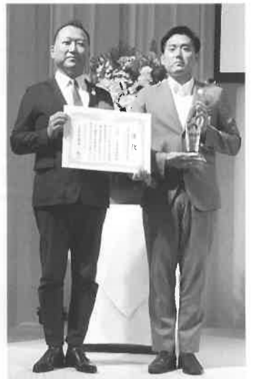
7月4日の授賞式にて。平塚社長(左)と平塚営業企画部長

MIRAI-LABO(株)の特殊LED投光器『X-teraso』がJECA FAIR2017製品コンクールで中小企業庁長官賞を受賞