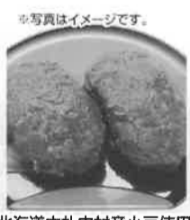
写真イメージです。 北海道中札内村産小豆使用 手造りおはぎ