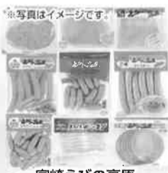
写真イメージです。 宮崎えびの高原加工肉