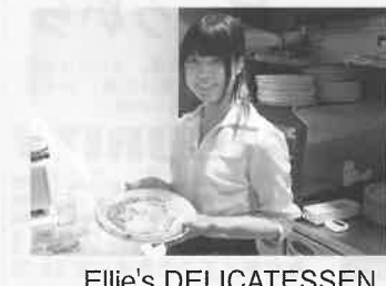
Ellie's DELICATESSEN CAFE&BAR・福島さん(横山町)