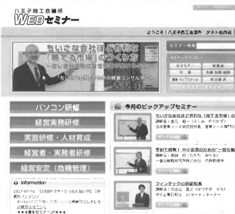
「WEBセミナー」トップページ