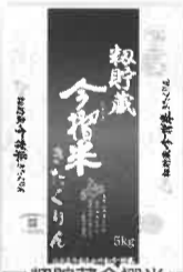
写真イメージです。 初野蔵今搦米 きたくりん