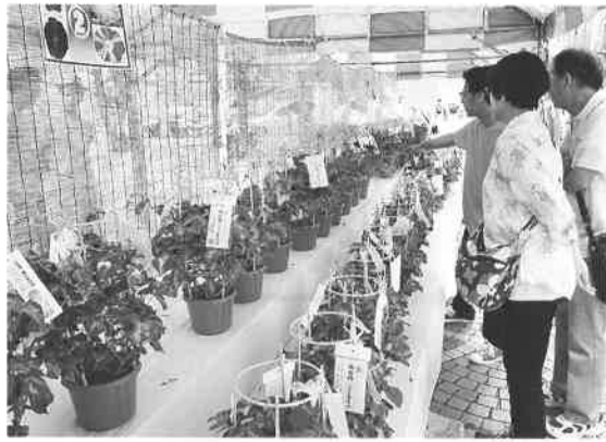
初日は鉢植えあさがおが完売