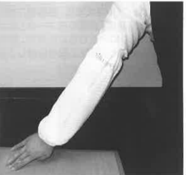
製作協力企業 吉田繊維(西寺方町)、中山メリヤス(天神町)

シルクレイズがオリジナル 防災アームカバーを製作 シルクレイズは、近年増えている高齢者の着衣着火事故の防止を目的に、オリジナルの防災アームカバー(フリースサイズ、長さ34cm)を製作しました。八王子商工会議所創立120周年時に提言した、産都市八王子の再生を目指す「グロ一カル産都市八王子」も合格しています。アームカバーは、1セット2400円(税込)で、会議所内で販売しています。問合せ先 会議所内「シルクレイズ事務局」 0623-16311