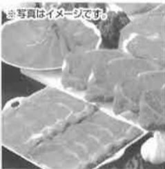
写真イメージです。 720牧場グループ牛

T192-0011 東京都八王子市蒲山町2-351 TEL042-692-2111(代)