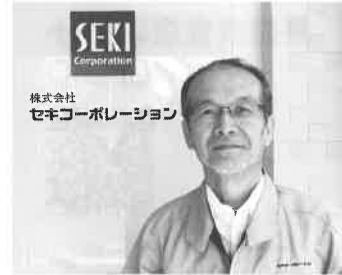
SEKI Corporation 株式会社セキコーポレーション

当社の経営理念は、「お客様に満足と信頼を得られる製品とサービスを提供すること」を