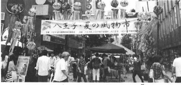
都市活性化イベントの展開