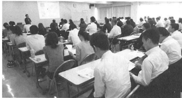
講演会・研修会の開催