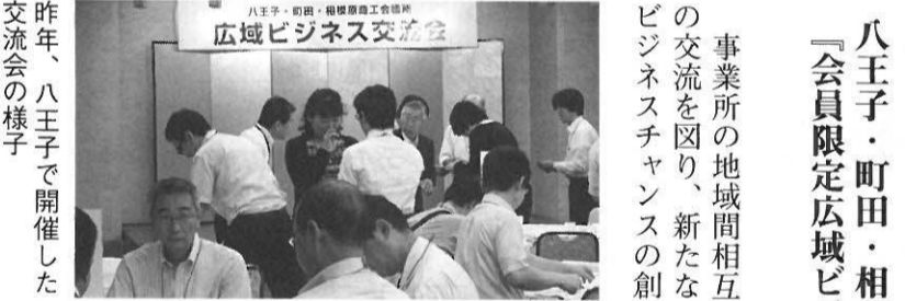
八王子・町田・相模原商工会議所「会員限定広域ビジネス交流会」

事業所の地域間相互の交流を図り、新たなビジネスチャンスの創出やビジネスパートナー発掘の場として開催します。詳細は、はちおうじ会議所だより5月号同封予定の広域ビジネス交流会参加申込書をご覧ください。とき/ところ 15時30分～18時 ホテルラポール千寿閣(相模原市南区上鶴間本町3-11-8) 参加費 2000円(1社2名まで) 問合せ先 山名・菅原 会議所 62316311