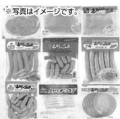
宮崎えびの高原加工肉