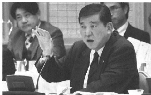
石破地方創生担当大臣