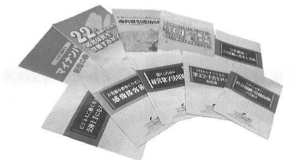
経営に役立つ冊子の配布