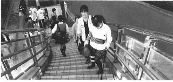
誰もが暮らしやすい街づくりの研究