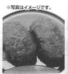
北海道中札内村産小豆使用 手造りおぼぎ