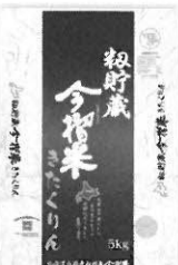
粉貯蔵今搦米 きたくりん