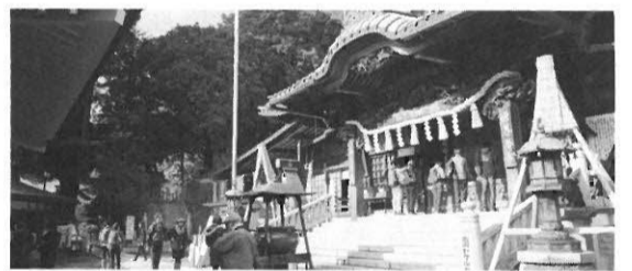
観光振興に関する事業