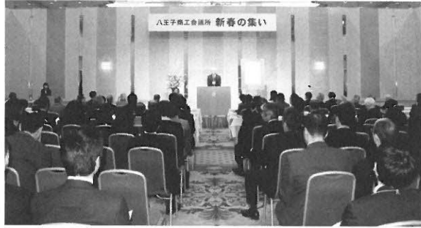
新春の集いの実施