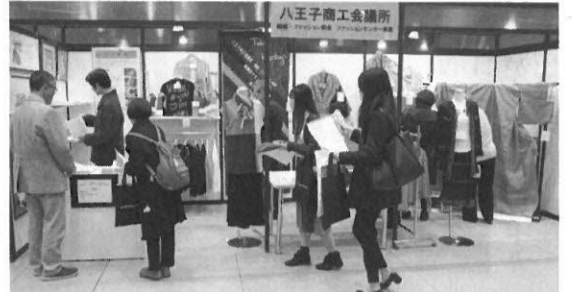
繊維産地活性化の事業