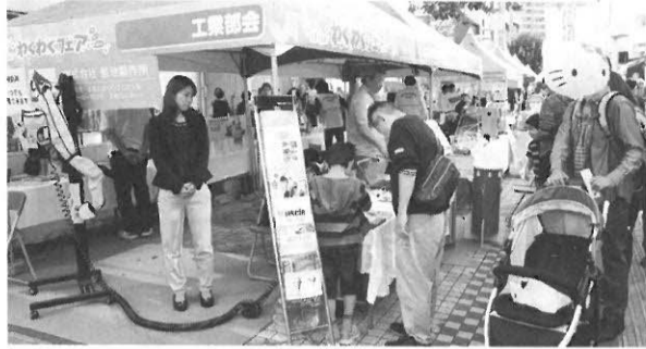
わくわくフェアの実施