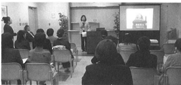
女性経営者の会シルクロードの活動