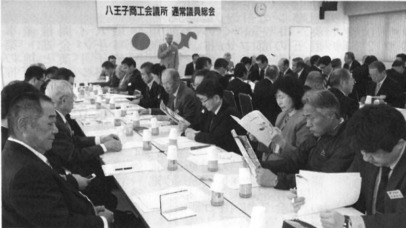
3月28日開催の通常議員総会で事業計画と収支予算を承認