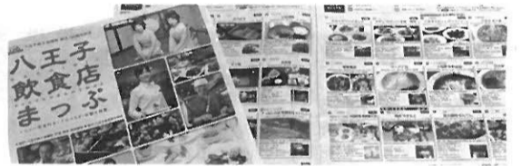
飲食店情報の発信