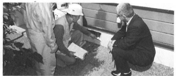
耐震お助け隊の推進