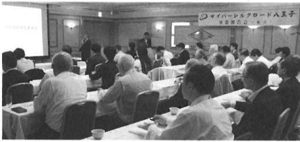
サイバースシルクロード八王子の事業推進

会員の意見、部会・委員会活動の成果を集約して、八王子市の将来を見据えた中長期の視点から、まちづくり