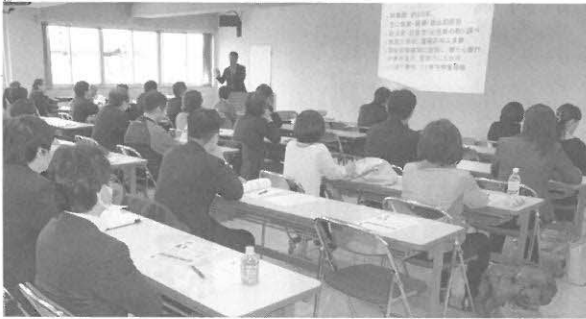
講習会・研修会の開催