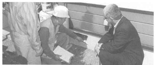
木造住宅耐震化普及啓発事業の推進