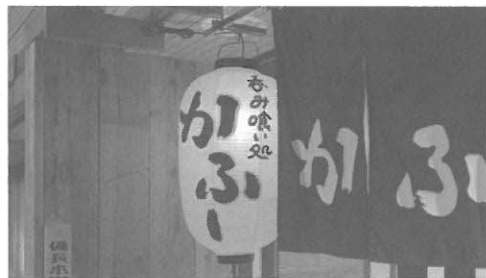
呑み喰い処かふー 営業時間17時～23時 毎週日曜、第1・3月曜定休