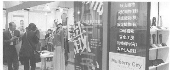
繊維産地活性化の事業