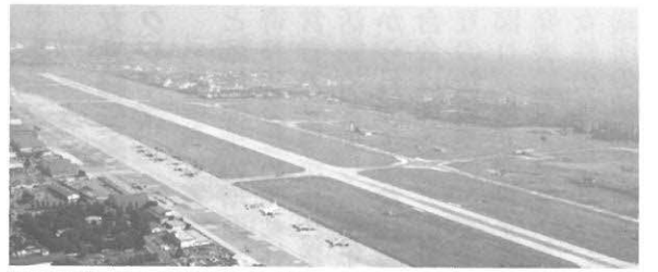
横田基地軍民共用化の推進