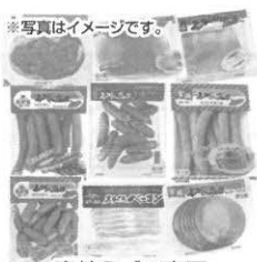
宮崎えびの高原加工肉