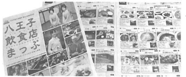
飲食店情報の発信