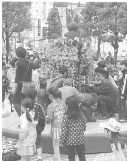
昨年の『花と緑のまちづくりフェア』より