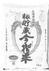
初貯蔵今搾米 ほしのゆめ