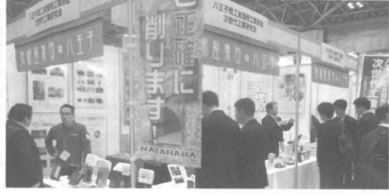
工業振興のための事業