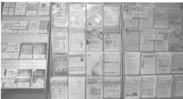
経営に役立つ小冊子の作成