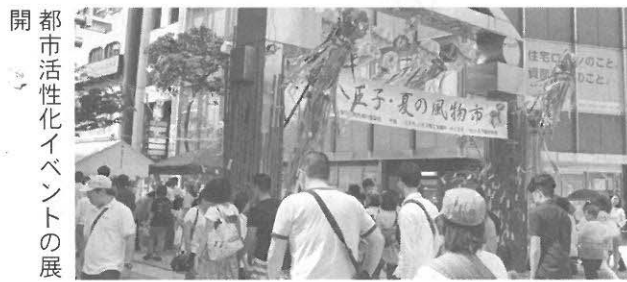
都市活性化イベントの展開