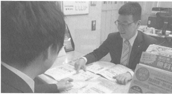
商工業者への巡回指導、窓口相談業務の実施