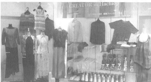
会議所1階展示コーナーでの市内生産品の展示