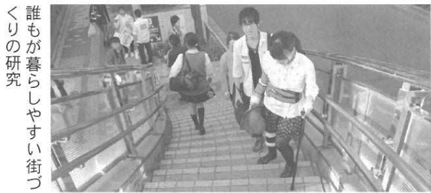
誰もが暮らしやすい街づくりの研究