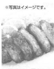
石田豚の柔らかく ロースとんかつ