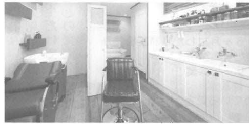
kafu-garden 営業時間9時～18時 定休日なし