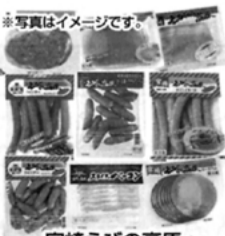
宮崎えびの高原加工肉