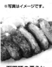
石田豚の柔らかく ロースとんかつ