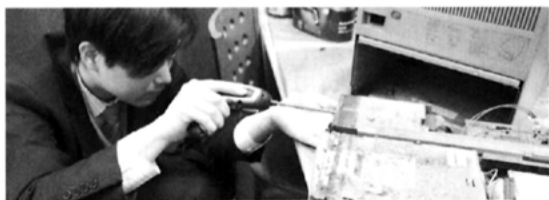
料金表【1台。消費税込】 カッコ内は訪問料金です。訪問は事業者に限ります。