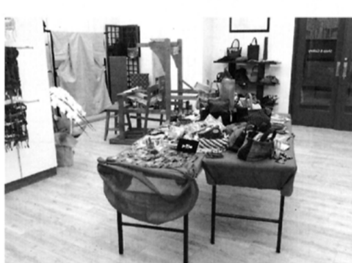
ベネックは織物組合前バス停下車 営業時間 10時~17時30分 水曜日・日曜日定休