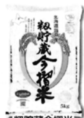
初貯蔵今搥米 ほしのゆめ