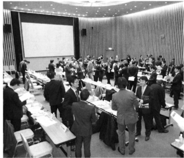
昨年、東京商工会議所ホールで開催した「ビジネス交流会」の様子