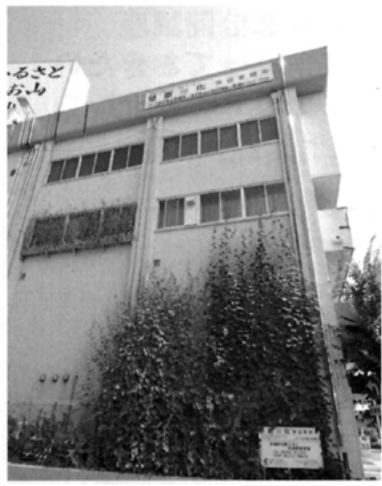
平成21年10月 省エネのために会 議所会館南側壁面 を緑化

を中心とした、明神町・ 旭町地区のまちづくり 計画を検討し『まちづ くり戦略考』JR八王子 駅周辺まちづくり構想 』を報告書にまとめ、 八王子市に提出した。