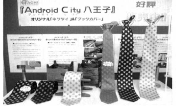
平成22年11月 サイバーシルクロード八王子がア ンドロイドシティ八王子を推進。 八王子織物活性化プロジェクトの 一環として、Googleオリジナルキ ャラクターのドロイド君を織り込 んだ特製ネクタイを製造・販売