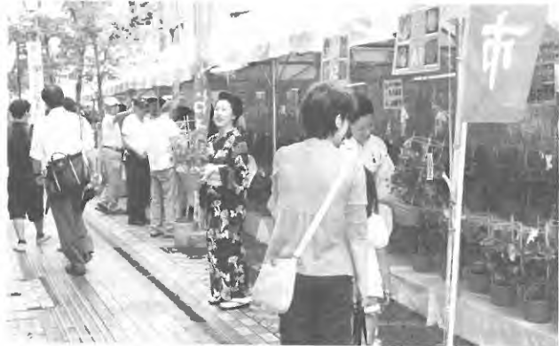
中心市街地活性化事業の推進