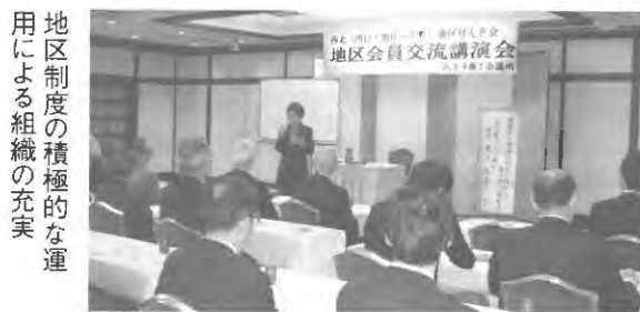
地区制度の積極的な運用による組織の充実