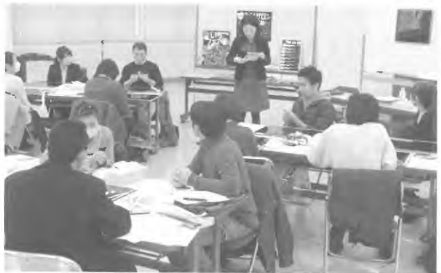
経営に役立つセミナーの実施

人材育成と雇用促進事業の推進 職業能力の向上、人材の育成など実践的な能力の向上を図るための各種検定事業を実施し、さらに職業能力向上のためのジョブ・カード制度の促進など労働人材の活用、育成事業を推進します。