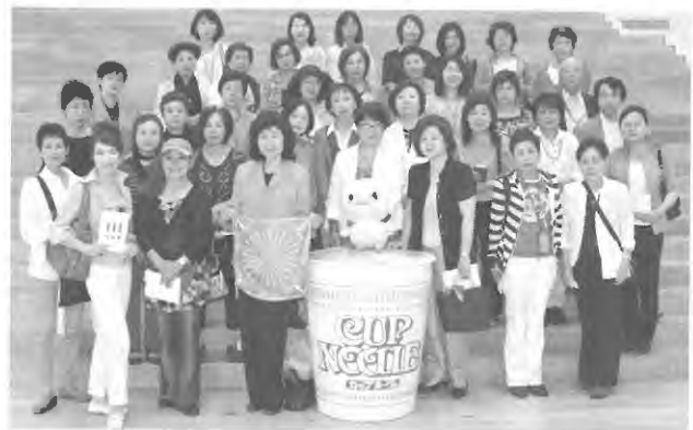
女性経営者の会・シルクレイズの活動への支援