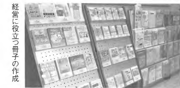
経営に役立つ冊子の作成