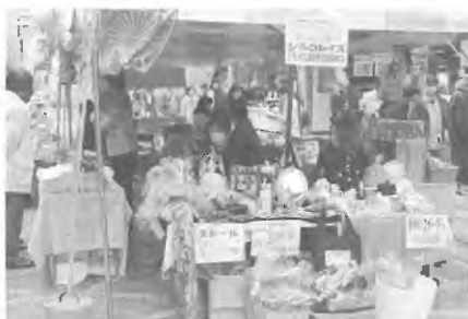
昨年の専用ブースより