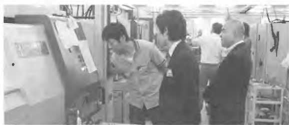
工業振興に関する事業