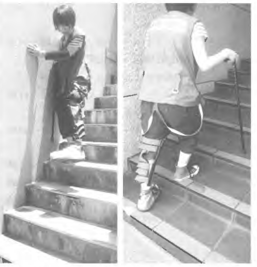
視野狭窄 階段蹴上りの差

出会いのチャンスを広げよう! 結婚をしたい人のための お見合いパーティー 5月18日開催 広報委員会