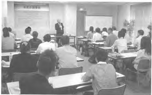
サイバーシルクロード八王子事業の推進

人材育成と雇用促進事業の推進 職業能力の向上、人材の育成など実践的な能力の向上を図るための各種検定事業を実施し、さらに職業能力向上のためのジョブ・カード制度の促進など労働人材の活用、育成事業を推進します。