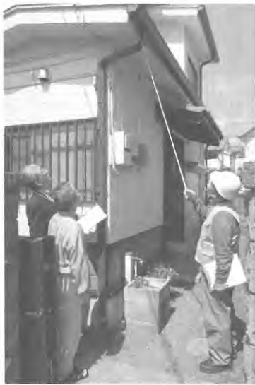
木造住宅耐震問題に関する推進

事業所をはじめ多くの地域の事業者の利便に資する事業を積極的に推進します。 ① 会館の運営と管理