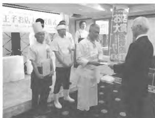
「地産・地消・地活」の具体的な展開