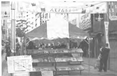
昨年の「八王子古本まつり」より

八王子古本まつり実行委員会は、5月2日(木)6日(月)10時~19時(最終日は17時まで)、八王子駅北口西放射線ユーロードで「八王子古本まつり」を開催します。古書店20店舗、福祉作業などの作品販売、地元ブースの物産販売、えほん交換会と読みかかせ会などを実施(雨天決行)します。今回は「歴史