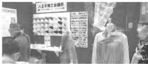
繊維産地活性化の推進