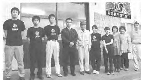
スタッフとともに

いる会長が、脳梗塞に倒れた時に私は一人で営業まで行い、2004年、20歳で社長に就任しました。戸惑いは清浄にするよう心がける、気を使うカッコい