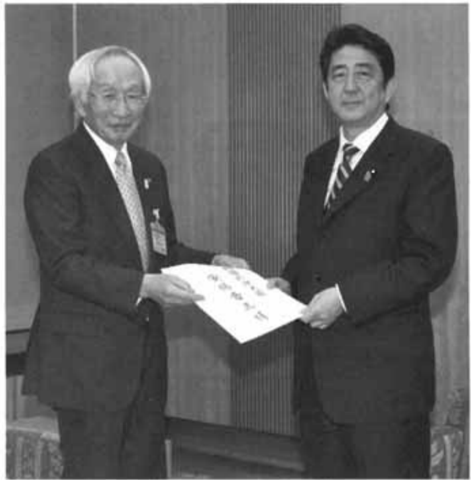
安倍総理に要望の実現を求める日商・岡村会頭

日商・岡村正会頭は、昨年12月27日、28日、今年1月9日に安倍総理大臣、麻生財務大臣、要望書「安倍内閣に望む」の内容を説明し、実現を求めました。