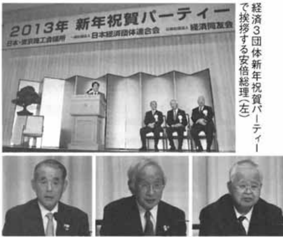
長谷川代表幹事(経済同友会) 岡村会頭(日本商工会議所) 米倉会長(日本経済団体連合会)

1月7日、日商は日本経済団体連合会、経済3団体新年祝賀パーティーで挨拶する安倍総理(左)。