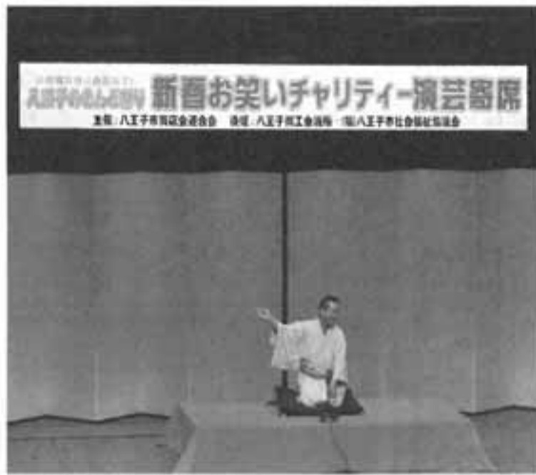
八王子あきんど祭り2012

大会期間中に約10万人以上が八王子を様々な形で利用することが想定され、大きな経済効果が見込まれます。市民とともに開催し、生涯スポーツ社会の実現を目指し、活力あるまちづくりを進める大会とし、全国各地から集う人々をおもてなしの心で迎え、ふれあいと友情の輪を広げ、豊かな自然や歴史、文化に恵まれた八王子市の魅力を全国に紹介し、地域振興を図ることを開催目標にしています。