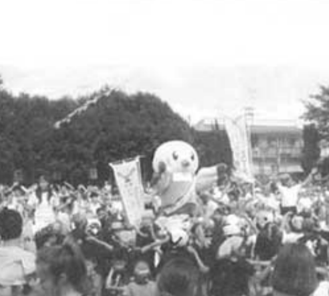
スポーツ祭東京2013のマスコット「ゆりーと」

大きなポイントになるのではないかと考えます。会議所としての考え方をまとめていきたいと思っています。