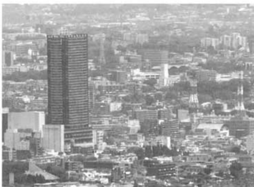
医療刑務所跡地は南口の大きなポイント

市長 再開発はある程度収束しました。これからは、八王子全体の都市計画マスタープランの策定作業に入ります。八王子駅南口周辺地区まちづくり方針を定め、その計画に沿って、南口のまちづくりを進めていきたいと思っています。