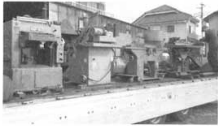
被災地復興支援プロジェクト第2弾 松島・花巻・陸前高田視察研修 震災の爪痕を後世に伝える 陸前高田の語りべ