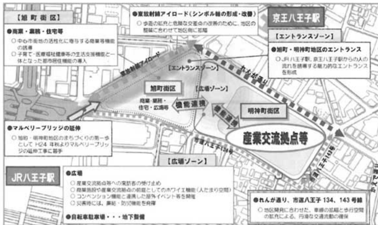
産業交流拠点整備に関する提案書より抜粋

【旭町街区】 ●商業・業務・住宅等 ○中心市街地の活性化に寄与する商業等機能の誘導 ○子育て・医療福祉機能等の生活交通機能と一体となった都市居住機能の導入 【旭町街区】 ●東放射線アイロード(シンボル軸の形成・改善) ○歩道の拡充と危険な交差点の改善のために、地区の整頓に合わせて地区内に整備 【旭町街区】 ●マルベリーブリッジの延伸 ○旭町・明神町地区のまちづくりの第一歩として、H24 年秋よりマルベリーブリッジの延伸工事に着手 【旭町街区】 ●JR八王子駅 ○産業交流拠点等への集約の受け止め ○商業施設や産業交流拠点の形成としてのホワイエ機能(人だまり空間) ○コンベンション機能と連携した屋外イベント等を開催 ○災害時には、集約・防災機能を発揮 ●自転車駐車場・・・地下整備 ●れんが通り、市道八王子 134、143 号線 ○地区開発に合わせて、車道の拡幅と歩行空間の拡充による、円滑な交通流動の確保