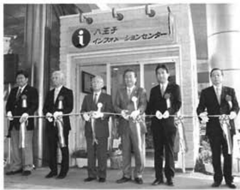
10月20日に行われた八王子インフォメーションセンターのオープニングセレモニー

八王子初の総合案内所がJR八王子駅北口にオープン 八王子インフォメーションセンター 八王子市は10月20日、オメイションセンター（運営主体・八王子観光協会）をJR八王子案内所「八王子インフォメーションセンター」をオープンしました。 このセンターは、当市が持つ様々な魅力ある資源の情報発信と案内、八王子の物産品の紹介などを最も多くの来訪者や市民が行き来する場所として実施し、一層の情報発信の充実とホスピタリティの向上に努めることを目的としています。 主な業務は、案内・観光・街なか・交通などの案内（バス、鉄道など）、ボランティア団体などとの連携による街案内や外国語対応、物産品の展示・紹介などです。