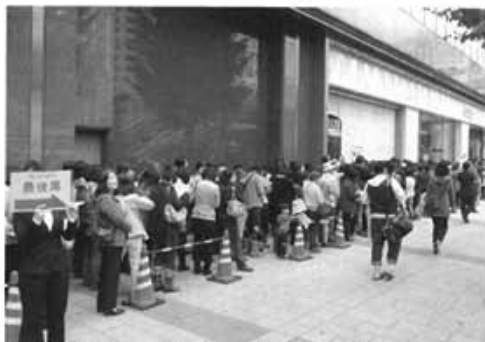
オープン前、入口で入店を待つお客様。約600名が並ぶ

地下1階、地上10階で、売り場面積は約29000㎡。単館としてはJR東日本管内で最大級。多摩地区最大級の食品売場をはじめ、ファッション、生活雑貨、ペーパー用品などの約200のショップが入店しています。