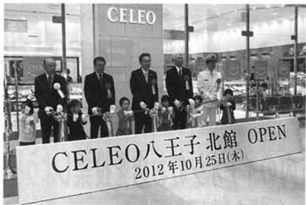
来賓と園児によるテープカット