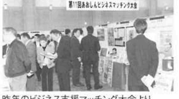
昨年のビジネス支援マッチング大会より

中小企業相談所では、税理士、弁護士、日本政策金融公庫、行政書士、ITアドバイザー、弁理士による無料専門相談を実施しています。 税理士、弁護士、日整を行い、相談日を設け、経験豊富な専門家親身になって対応します。予約制で、対応時間は、平日10時~16時、会議所1階相談室で行います。 【行政書士】 会社の作り方。相続手続き。事業承継への準備。著作権の保護と利用。営業許可。契約書。電子申請など。 【弁理士】 特許。意匠。商標権。著作物に関する権利。知的財産に関する仲裁手続きなど。 【IT】 パソコン選び(リース、中古)。ウイルス