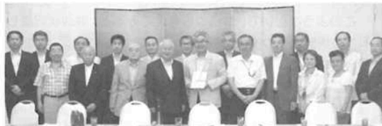
須賀川商店会連合会に募金を届けた八王子市商店会連合会一行