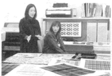
多摩テクノプラザのデザインルームにて