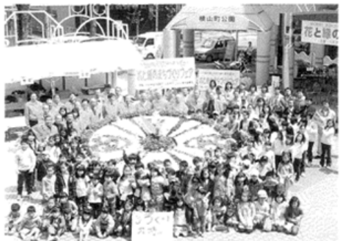
昨年の花と緑のまちづくりフェアより

「花と緑のまちづくりフェア2011」をJR八王子駅北口、西放射線ユーロードなどを中心に4月23日(土)、24日(日)に実施します。子どもたちによる花時計作りをはじめ、花と音楽で街がにぎわいます。詳細は、3月号でお知らせします。