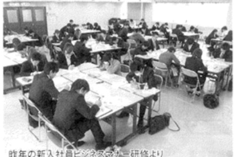
昨年の新入社員ビジネスマナー研修より