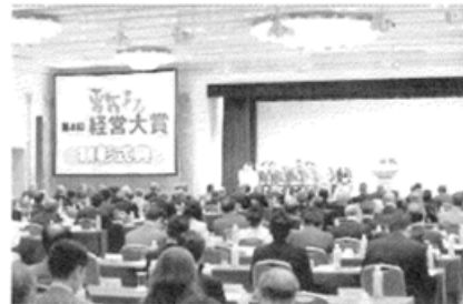
第8回顕彰式典より

革新的・創造的な技術やアイデア・経営手法で 独自性のある製品・サービスを生み出す企業を顕彰