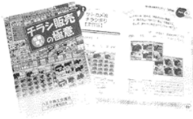
『チラシ販売の極意』28頁

商工会議所中小企業相談所では、経営に役立つガイドブックを多数ご用意し、提供しています。