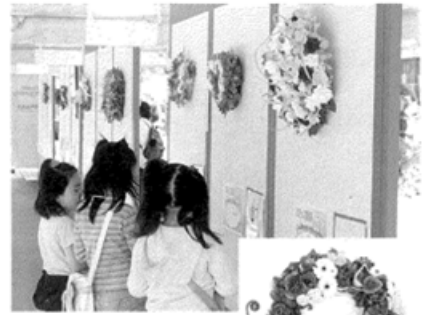
昨年のリースコンテストより

■応募方法と募集締切 所定の申込書に必要な事項を記入のうえ、八王子ファッション都市協議会事務局(商工会議所内)までお申し込みください。 申込書は、商工会議所、市事務所、市民センターに備えています。締め切りは、3月23日