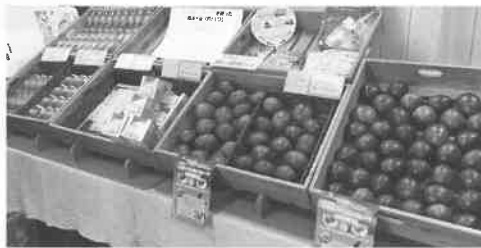
パッションフルーツと加工商品の販売

「甘酸っぱい味わいで美味しい」「最近よくパッションフルーツを耳にするようになった」と、沢山の反響をいただき、商品はほぼ完売状態。PRの手応えを感じました。 夏が旬のパッションフルーツ。今年も沢山のの方に味わっていただきたいと思います。八王子まつりにお越しの際には、ぜひお立ち寄りください。