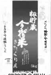
初貯蔵今搗米 きたくりん