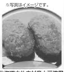
※写真はイメージです。 北海道中札内村産小豆使用 手造りおはぎ