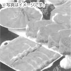
※写真はイメージです。 フェニク 720牧場グループ牛

〒192-0011 東京都八王子市海山町2-351 TEL042-692-2111(代)