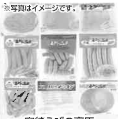
※写真はイメージです。 宮崎えびの高原加工肉