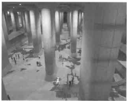
首都圏外郭放水路

会議所会員サービス委員会では、地下神殿のような神秘的な造りで人気の『首都圏外郭放水路』と浅草で美味しいと評判の『葵丸進』の天ぷらをご賞味いただきます。 だき、築地市場から移転した『豊洲市場』の見学バスツアーを企画しました。 皆様のご参加をお待ちしています。 とき/行程 8月1日 (木) JR八王子駅南口