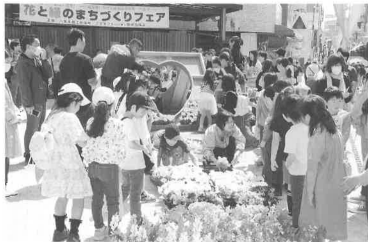
花モニュメントの制作