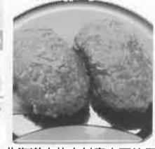
北海道中札内村産小豆使用 手造りおぼろ