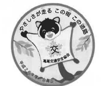
ガイド姫を手にする狩野代表(上) 高尾交通安全協会のステッカー に狩野代表がデザインしたムサ サビが採用されている

◎ものづくり大好き！ 「アミューズメント 業界の商品企画、デザ インなども手掛け、ユ ニバーサルスタジオリ ヤパンの立ち上げの時 に、ステーションナリ