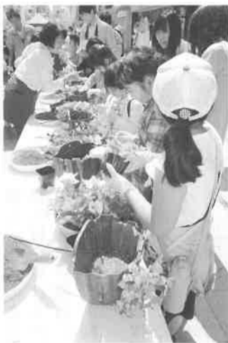
ハンギングバスケット制作と展示