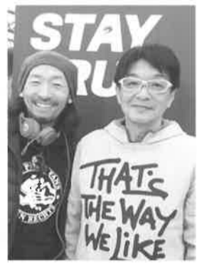
小川社長(右側) します。

◎蹴り方を身に 付ける育成球 「Jリーグの アカデミーのコ ナダでこのリーグのチ ームも使用し始めてい ます」。