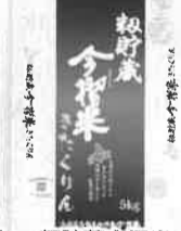
粉貯蔵今搦米 きたくりん