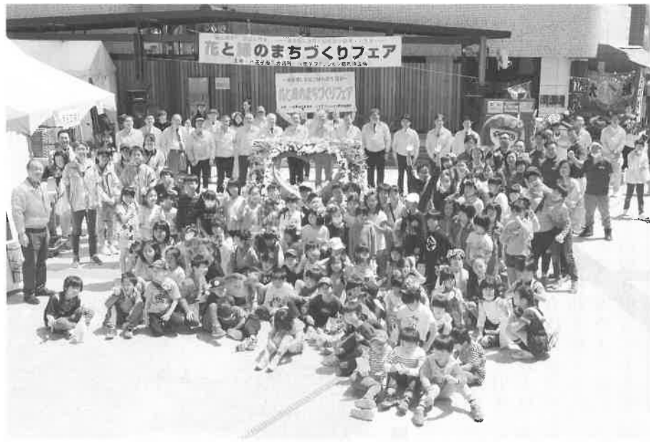
花モニュメントとともに記念撮影