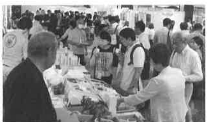
昨年と同フェアの様子

14回目となる今回は、山梨・東京・神奈川の太陽や大地の恵みをつづり受けた「安心・安全」な食材を紹介し、農・食品関連事業者と「食」のバイヤーとの商談の場を提供します。ぜひ本商談会にご