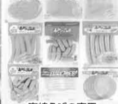
宮崎えびの高原加工肉