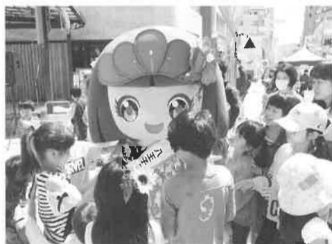
松姫マッピィが応援に

などが行われた。また、21日には、みずき通りで春のフェスティバルも開催され、2日間延べ20000人が来場し、賑わいを見せた。