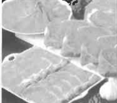
ナニワ 720牧場グループ牛