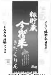
初貯蔵今搾米 きたくりん