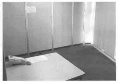
ブルームセンター内

京王八王子駅徒歩1分のサイバーシルクロード八王子事務局の同ビル7階にあるインキュベーション施設「ブルームセンター」(明神町)では、現在入居者を募集しています。