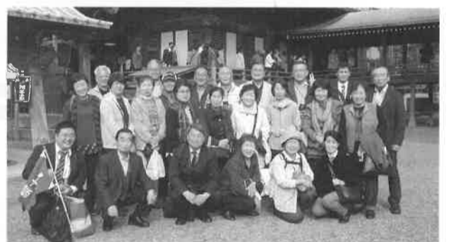
会員サービス事業の促進

中小企業・小規模事業者を支援する国の施策である経営改善普及事業を推進し、国・都・市の施策情報の提供、活用を促進する。 ・商工業者への巡回指導、窓口相談業務の実施