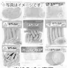
宮崎えびの高原加工肉