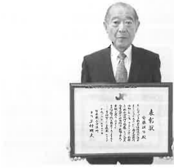
安藤副会頭 (3月27日撮影)

精密板金だけでなく、 多品種少量生産から小ロット量産まで対応する 総合板金加工業です。 精密板金から大型筐体まで一社で対応できる 会社は少なく、溶接を伴う加工は得意分野です。ステンレス、鉄、アルミなど様々な材料 精密板金だけでなく、 多品種少量生産から小ロット量産まで対応する 総合板金加工業です。 精密板金から大型筐体まで一社で対応できる 会社は少なく、溶接を伴う加工は得意分野です。ステンレス、鉄、アルミなど様々な材料 加工しています。会長(父)が昭和46年4月に大和田町で起業し、55年に石川町の工業地帯に移転しました。私は、化粧品会社の美容部員を経て、平成13年に入社し、25年に社長に就任しました。就任当時は解らないことが多過ぎて弱気になりましたが、支援機関や社員からアドバイスを受け、社外にも目を向ける様になりました。30年に当社の経営理念を「想いを共に作り、絆を育む」と定めました。これは、お客 様の想いに寄り添い、お客様と一緒に一つ一つのづくりをしていくことで、お互いになくしてはならない信頼し合える関係を築いていくという事です。お客様から求められる仕事をして、社員が幸せでいられることを一番の目標にし、安心して働ける職場づくりを目指しています。 私が生まれ育った八王子ですので、今後でも元氣な街であり続けて欲しいのです。少しでも街のためにお役がたればと思います。(3月19日取材)