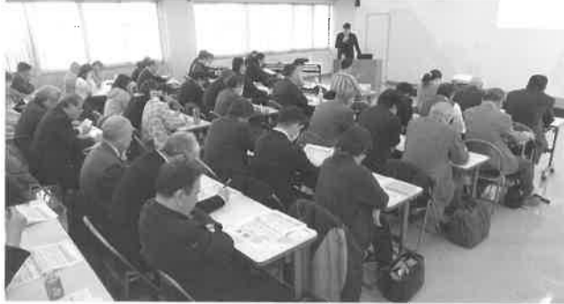
経営に役立つ講習会の開催

八王子の持つポテンシャルと地域特性を活かし、経済活動が活発に行われ、持続的に発展するための多様な事業活動を展開する。 ・「グローバル産業都市八王子」実現への取り組み ・八王子市中心市街地活性化協議会の事業推進 ・JR八王子駅周辺、西放射線ユーロードなど歩行者空間整備の推進 ・産業交流拠点と旭町・明神町地区再開発の一体的整備推進 ・横浜線、八高線のシームレス化と多摩都市モノレール導入の研究