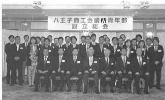
青年部(八王子YEG)の活動

貿易振興に関する事業 ・ 国・都市の補助金、助成金、融資制度など施策情報の周知、斡旋、取次 ・ 日本政策金融公庫による定例相談窓口の開設 ・ 税務、法律、知財、事業承継に関する専門相談、記帳指導の実施 ・ 小規模企業振興委員と経営指導員の連携 ・ 国による経営発達支援計画の検討 ・ 地域プラットフォーム事業の推進 ・ 小規模企業共済制度の普及、加入促進 ・ 中小企業倒産防止共済制度の普及、加入促進 ・ 相談事業に関するポスター、パンフレットの作成配布