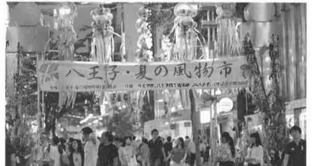
都市活性化を目指したイベントの実施