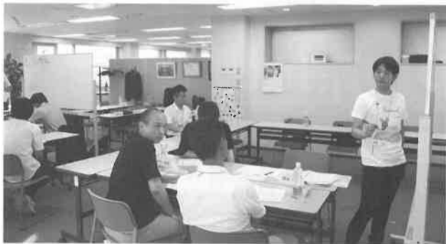
はちおうじ未来塾の実施