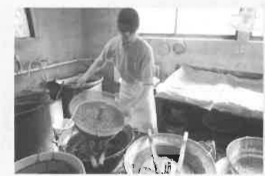
甘露納豆みつ橋(追分町)

株栄文舎 印刷業、企画プランニング 堀之内 株 Selection スポーツ用品輸入業 堀之内 (有)森田製作所 金型設計製作 榎原町 社会福祉法人親和福祉会 特別養護老人ホーム 犬目町 ヘア&エステミスティ ジャズラウンジミスティ 美容室、飲食店 本町 おそうじ本舗三鷹南店 清掃業 大和田町 一般社団法人助成金人事務支援協会 コンサルティング業 静岡県