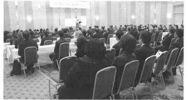
会員交流を目的とした事業の実施

経営者、新入社員のための経営・技術講座の開催 ・新入社員のためのビジネスセミナーの開催 ・環境社会、ビジネスマネジャーなどの検定実施と講座の開催 ・中小企業退職金共済制度の加入促進 ・特定退職金共済制度の加入促進 ・生命共済、終身医療、ガン保険などの普及、加入促進 ・日本商工会議所損害保険制度の普及、加入促進 ・労働諸規定、規則の作成指導 ・賃金、雇用などの労働情報提供 ・労働保険、公害健康被害補償制度の事務代行 ・労務に関する調査の実施、講習会、説明会の開催