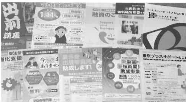
会議所施策、国、都の施策の周知幹旋