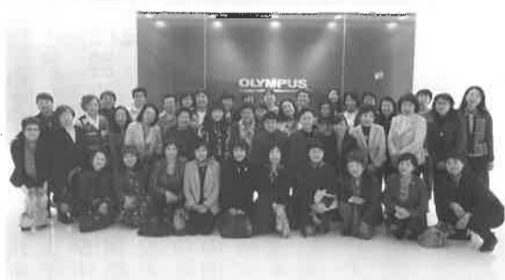
女性経営者の会シルクレイズの活動