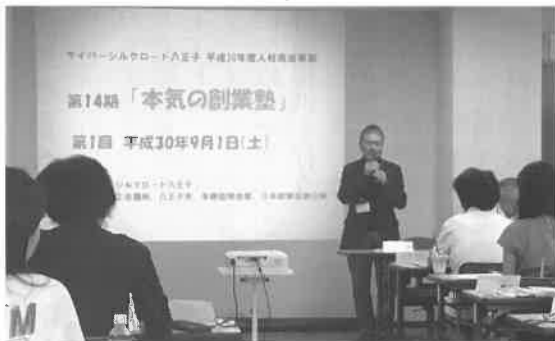
サイバーシルクロード八王子の活動