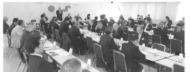
3月26日開催の通常議員総会にて承認