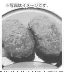
北海道中札内村産小豆使用 手造りおぼろ