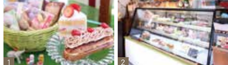
1. ケーキだけでなく焼き菓子も豊富 2. 2007年にオープンし今年で10年目